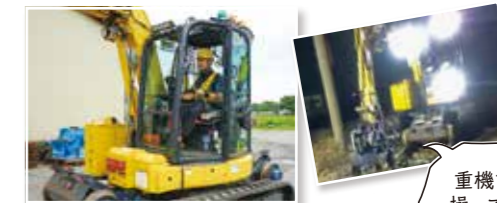
重機を操って、効率よく

良かったこと、やりがい 重機オペレーターとして枕木交換などを担当。先輩の指導で仕事を覚え、難しい仕事ほど達成感があります。念願の家を建て、子どもの学校行事にも皆勤賞! 充実しています。