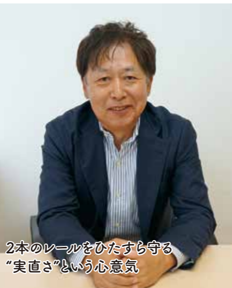
2本のレールをひたすら守る “実直さ”という心意気

世界一の技術を誇る日本の鉄道。誰もが“安全で当たり前”と信じている日常を支え、常に安全を最優先したメンテナンスを手がけることが当社の役割です。その技術と実績は、秋田・山形ミニ新幹線、東北新幹線青森延伸工事などでも高い評価を得ています。mm単位で管理する保線作業や迅速な災害復旧を担うのは、人間の経験や技術と、2本のレールをひたすら守る“実直さ”という心意気。その未来を担う若い力を求めています。