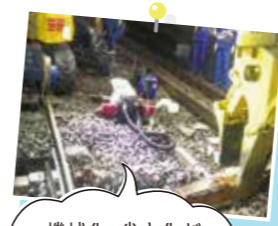
機械化・省力化が進む鉄道保守工事

当社の主な業務は、終列車運行後の夜間に行います。線路を構成しているレール、マクラギバラスト(碎石)の交換、日々の運行で生じた狂いを修正する作業です。機械化・省力化は年々進んでいますが、mm単位の施工精度を達成するのは人の経験と技術。線路状態の検査から修繕までの総合体制の整備を目指しています。