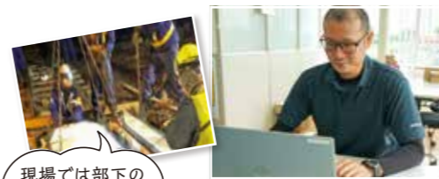
現場では部下の安全が最優先

良かったこと、やりがい イキイキとこの仕事をしてきた父の影響で就職しました。日々の発見で精度を上げ、鉄道の安全運行と部下の命を預かる仕事。作業を終えて一番電車を見送る充実感は最高です。